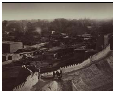
Городская стена и базарная площадь в Ходженте. Фотография 1860-х годов